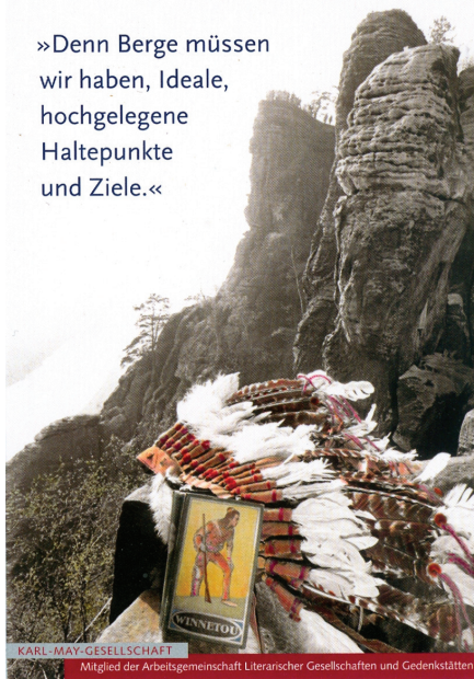
KARL-MAY-GESELLSCHAFT Mitglied der Arbeitsgemeinschaft Literarischer Gesellschaften und Gedenkstätten

»Denn Berge müssen wir haben, Ideale, hochgelegene Haltepunkte und Ziele.«