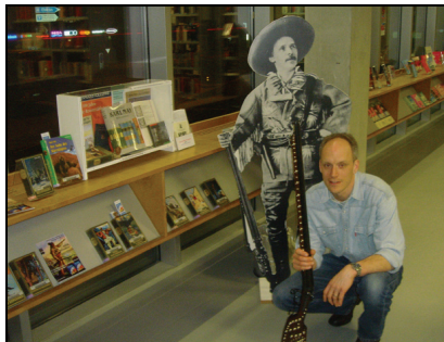
Ausstellungsvitrine und Silberbüchse durfte nicht fehlen