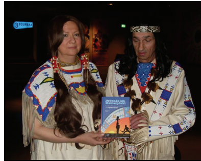
»Indianer« präsentieren eines seiner Bücher