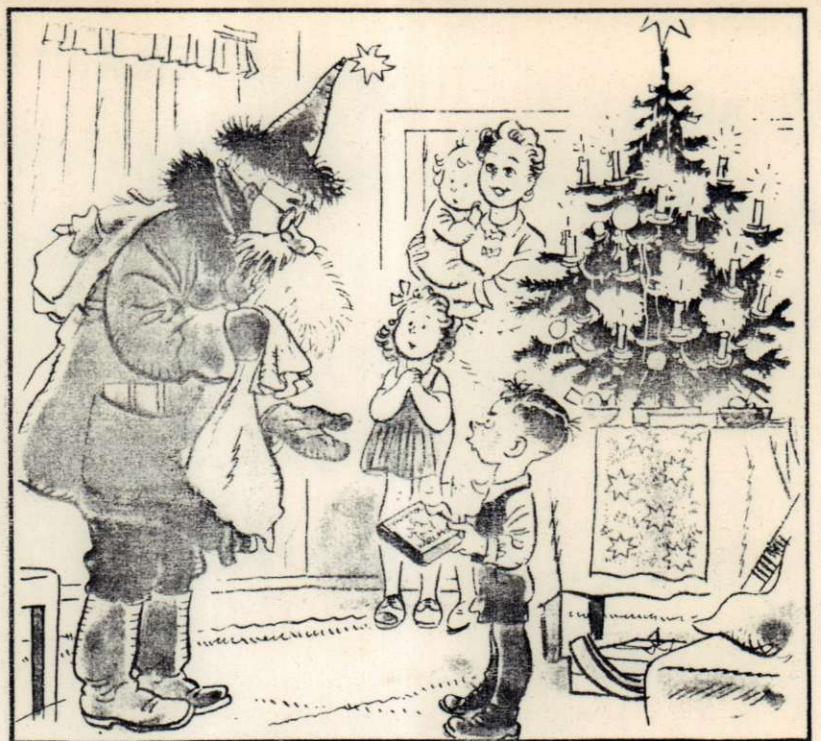
„— Karl May ‚Winnetou‘ is ja jut — aber wo is denn der Zauberkasten und det Mühlespiel, guter Alter? Wohl noch nischt von Leistungssteigerung je hört, wat?!“