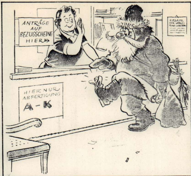
Kartenstelle, 24. Dezember: „Lassen Sie man ruhig den Quatsch, Herr! Sie sind heute schon der dritte, der mit 'nem alten Stiebel und der dofen Maske hier versucht, die Weihnachtsstimmung auszunützen . . .“