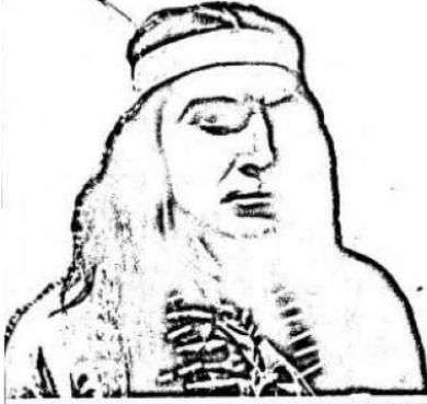
Winnetou, der oberste Häuptling