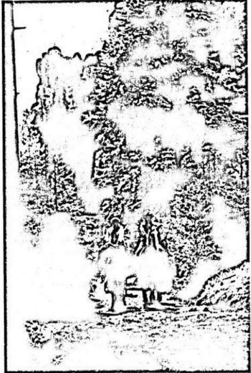
Old Shatterhand und seine Leute auf einen Ritt

Auf der Felsenfläche in der Nähe des Indianischen Dorfes... (Text is partially illegible due to image quality)