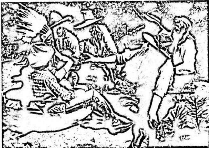
Die Friedensspiele geht um