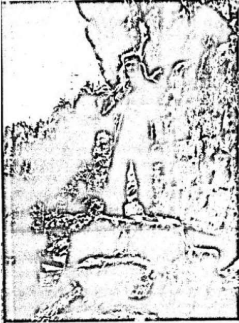
Nach den natürlichen Felskulisen ist Winnetou echt wie in seiner Urhelmat