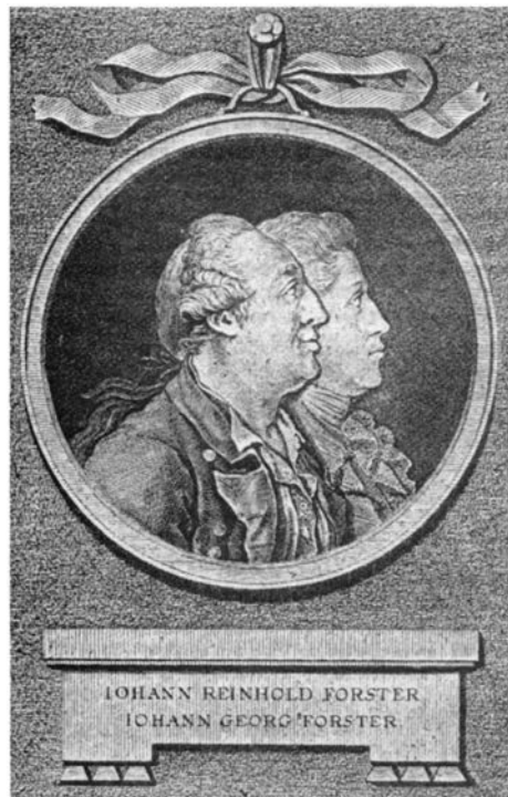
Reinhold und Georg Forster (Kupferstich, 1782)

Auf den Topos des in Deutschland aus politischen Gründen Geächteten trifft man bei May bekanntlich mehr als einmal (als