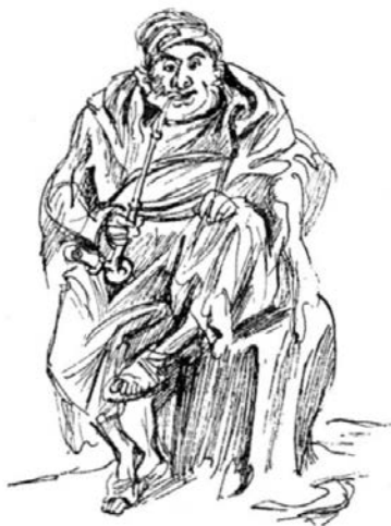
Baruch (Zeichnung von Karl Friedrich Brust)

Aus dem Lexikon natürlich. Dem ›Pierer‹. Sinnvollerweise aus dem Artikel Hebräer. Und da aus dem Abschnitt