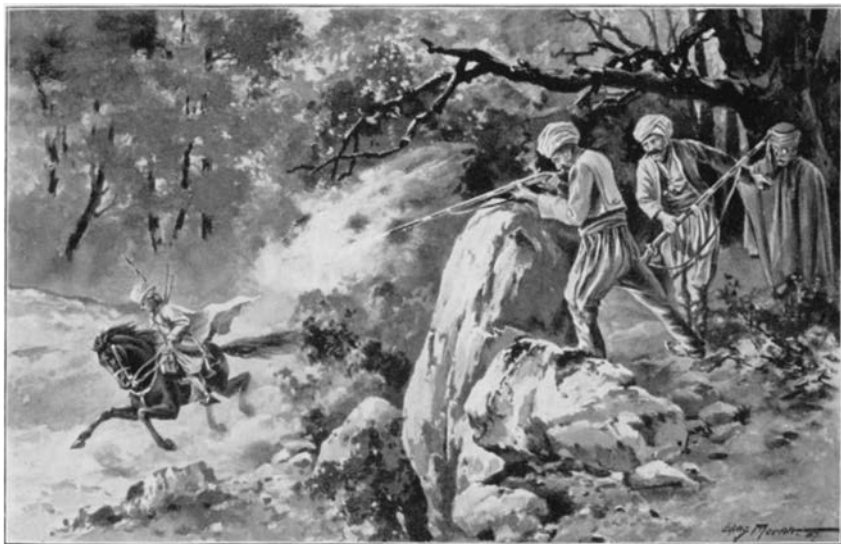
Sandar und Bybar schießen auf den vorbeigaloppierenden Halef (Illustration von Willy Moralt)

Auf die ›Mutter aller Städte‹, auf Babylon und Babylonien besann sich Karl May immer wieder. Und er teilte aus diversen Enzyklopädien mit, was er dort gelesen hatte. 3