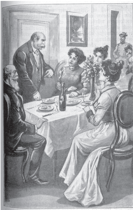
Abb. 3. Oberförster von Rodenstein bittet für den Herzog von Olsunna um Frau Sternaus Hand.

Diese Charakterisierung wird durch den weiteren Verlauf der Ereignisse bestätigt (ebd., 443–549). Der Herzog sieht die deutsche Gouvernante Fräulein Wilhelmi, bringt sie dazu, Gouvernante seiner Tochter zu werden, betäubt sie eines Abends mit einem Liebestrank und vergewaltigt sie. Fräulein Wilhelmi wird schwanger und heiratet den Lehrer Sternau, der sie schon seit langem liebt. Der Herzog weiß nicht, dass er einen Erben hat, und erfährt dies erst viel später von der Zigeunerin Zarba. Nach den schon erwähnten Ereignissen um Flora und Otto von Rodenstein bittet er die verwitwete Frau Sternau um Verzeihung und will sie heiraten. Frau Sternau vergibt ihm zwar, hat aber zunächst Bedenken gegen eine Heirat: